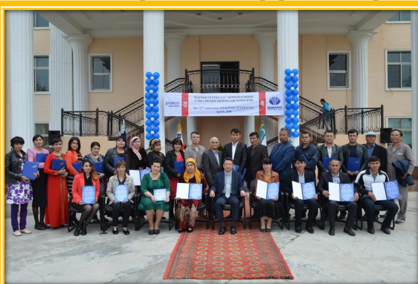
Фахрий ёрлик билан тақдирланган 26 нафар ходимлар.