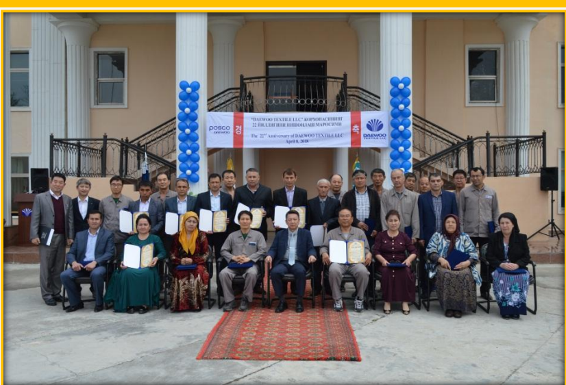
20 йиллик фидокорона хизматлари учун Ташаккурнома билан тақдирланган 18 нафар ходимлар.